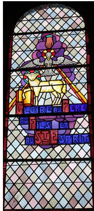
VITRAIL APRÈS RÉFECTION