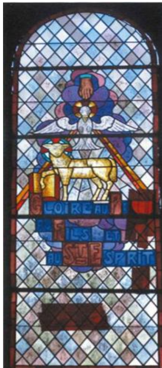
VITRAIL AVANT RÉFECTION