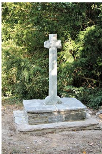
CROIX DE SAINT-JUGON