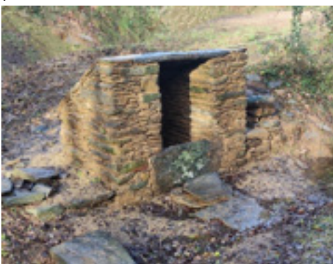
Puits de la Ville d'Aval à La Gacilly

De grands palis de schiste, restitués par un nouveau riverain, ont permis à la construction de retrouver sa toiture d'antan.