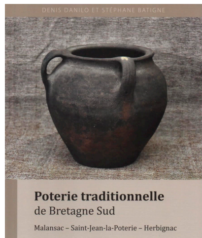
Poterie traditionnelle de Bretagne Sud

A l'issue de cette rencontre avec un public de passionnés, les auteurs dédicaçaient leur livre. Ce dernier est disponible chez Amélie à la librairie La Grande Évasion, 21 rue La Fayette La Gacilly.