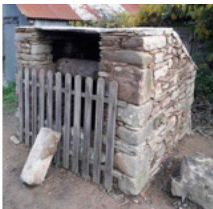
Puits du Bas Roussimel à Glénac

Après le puits des "Vaux" en 2021, l'association a souhaité poursuivre la restauration de 4 puits en 2022 et 2023. Les services techniques de la mairie s'investissent dans ce nouveau projet