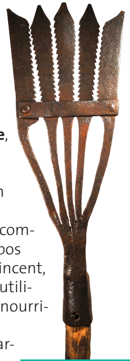
Fouëne pour la pêche à l'anguille