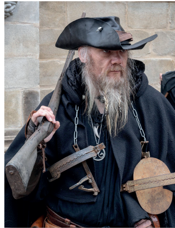
Louvetier et quelques accessoires de piégeage

La toponymie elle-même est un témoin de la présence du loup en haute et basse Bretagne : Creach-Bleiz (promontoire du loup), Pont-ar-Bleiz (le pont du loup), Ty-Bleiz (maison du loup)... et les appellations françaises sont toutes aussi nombreuses : le Bois-du-Loup (56), la Fosse-au-Loup (35)... à la Gacilly : "la vallée du four au loup" appellation d'une parcelle du plan cadastral de 1824. Ainsi cette nomination des lieux enregistre bien l'impact de la confrontation du loup et de l'homme, aux travers les âges.