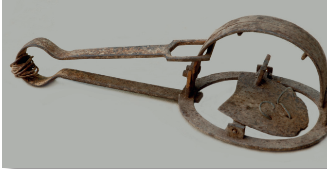
Piège à loup (43 x 13 cm) en position fermée