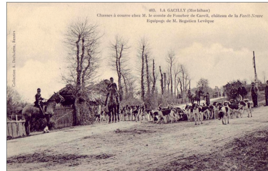
Les chiens de meute "bâtards anglo-saintongeais" du château de la Forêt Neuve

Retrouvez l'article complet sur le site : Lagacillypatrimoine.com